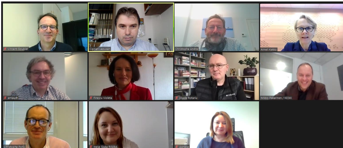
Comitetul de Coordonare ProCESS

The European Commission's support for the production of this publication does not constitute an endorsement of the contents, which reflect the views only of the authors, and the Commission cannot be held responsible for any use which may be made of the information contained therein.