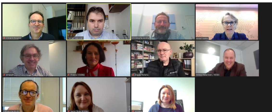
Le comité de pilotage du projet ProCESS

The European Commission's support for the production of this publication does not constitute an endorsement of the contents, which reflect the views only of the authors, and the Commission cannot be held responsible for any use which may be made of the information contained therein.